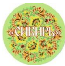
НКО «Центр русской культуры «Сибирь»